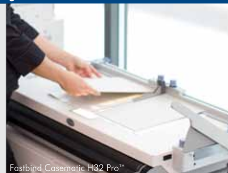
Fastbind Casematic H32 Pro™

Po wykonaniu okładki możesz oprawić książkę za pomocą jednej z maszyn do perfekcyjnej oprawy Fastbind. Co niezwykle istotne, Fastbind zapewnia Ci wszystkie niezbędne materiały eksploatacyjne do produkcji twardych okładek w środowisku cyfrowym "na żądanie".