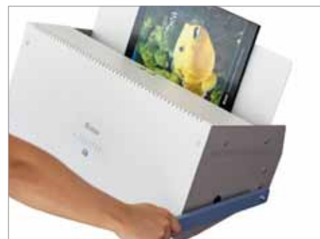
Prasa jest niezwykle prosta w obsłudze.